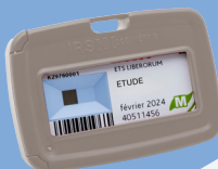
Neutron (voir fiche produit)