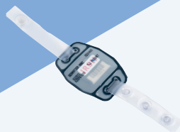
Poignet (voir fiche produit)